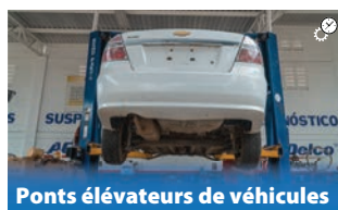
Ponts élévateurs de véhicules