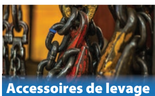
Accessoires de levage