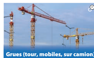
Grues (tour, mobiles, sur camion)