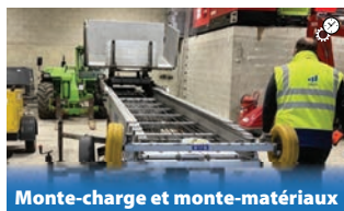
Monte-charge et monte-matériaux