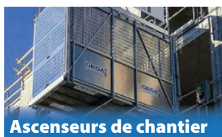
Ascenseurs de chantier