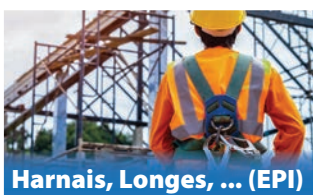
Harnais, Longes, ... (EPI)