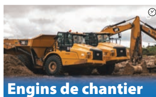
Engins de chantier