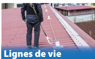
Lignes de vie