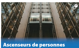
Ascenseurs de personnes